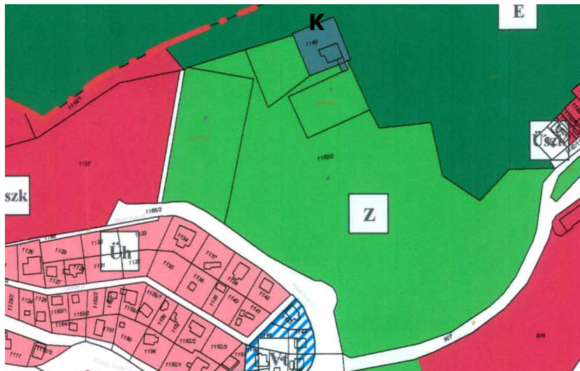
Módosítás előtti Településszerkezeti tervrészlet